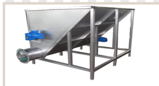
VASCHE DI RACCOLTA DOSATRICI

System for grape marc transportation Système de transport de marc épuisé