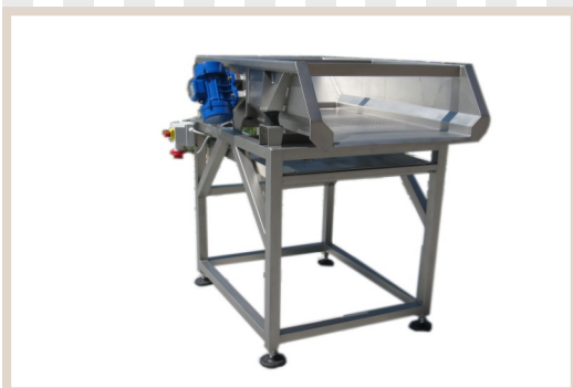
DISTRIBUTORI SGRONDANTI Distributor to drain Distributeur pour le drainage