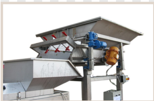
DOSATORI CON ASPI ROTANTI Dispenser with rotating beaters Distributeur à lames rotatives