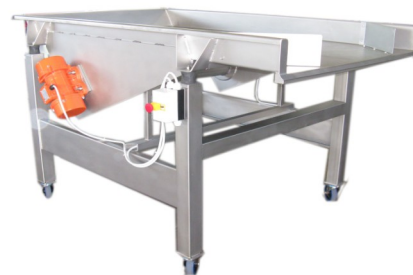
DOSATORI-SEPARATORI Dispenser-divider Distributeur séparateur