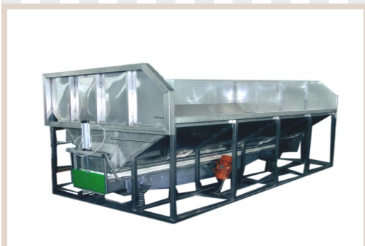
CONVOGLIATORI FINO A 8 TON Woven-wire capacity 8 ton Convoyeur capacité 8 t.