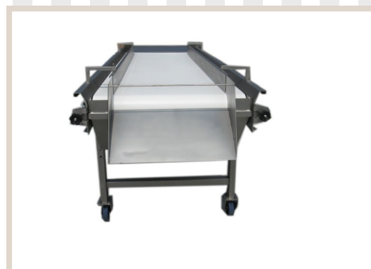
TAVOLI SELEZIONE CON CANALI LATERALI Selection machinery with lateral conduits Machine de sélection avec canaux latéraux .