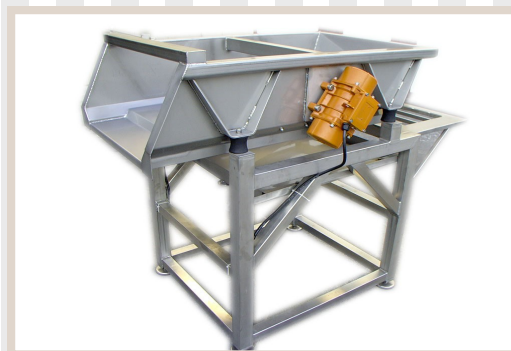
DOSATORI SGRONDANTI CON APPOGGIO Distributor to drain with a support Distributeur pour le drainage avec support