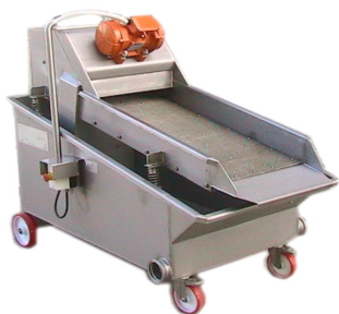
SVINATORI Machinery to remove grape seed machine pour enlever les pépins de raisin