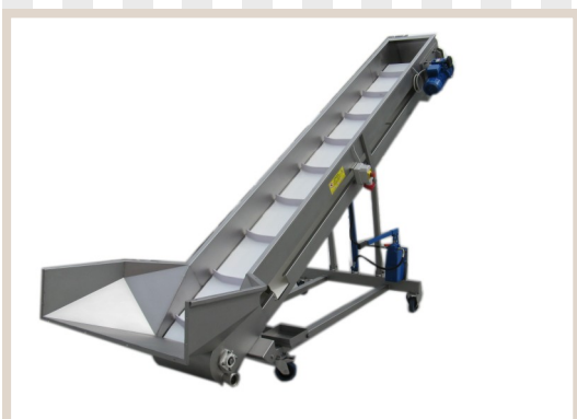
ELEVATORI A NASTRO MD400 Fork lift truck with conveyor belt élevateur avec tapi