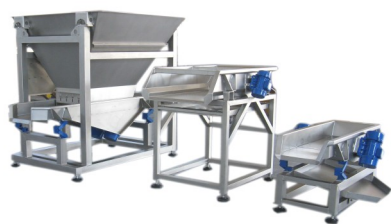
DOSATORI Dispensers Distributeur