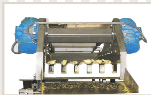
SEPARATORI GRANULARI Granular separator Séparateur granulaire