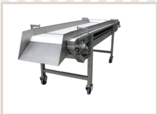
TAVOLI SELEZIONE A NASTRO Selection machinery with conveyor belt Machine de sélection avec band