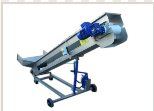
ELEVATORI A NASTRO MD300 Fork lift truck with conveyor belt élevateur avec tapis