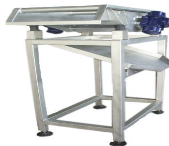
SNEVATORI GRANULARI Selector Machine de sélection