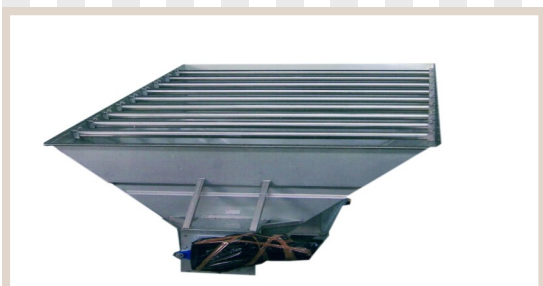
CONVOGLIATORI A COCLEA INCLINATI

Woven-wire to drain Cuve pour le drainage