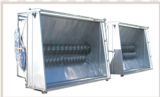
CONVOGLIATORI RICEZIONE UVA CON ROMPIPONTE

Woven-wire to receipt grapes Réception de raisin bain pont de commutation