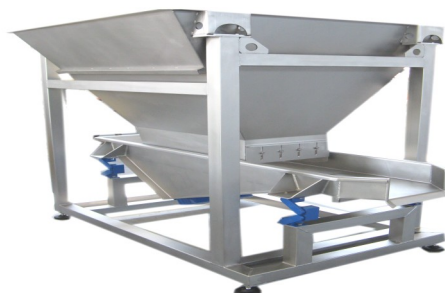
DOSATORI CAPIENZA 1500 KG. Dispenser capacity 1500 Kg Distributeur Capacité 1500 Kg.