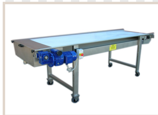
TAVOLI SELEZIONE A NASTRO Selection machinery with conveyor belt Machine de sélection avec band