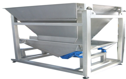
DOSATORI Dispenser Distributeur