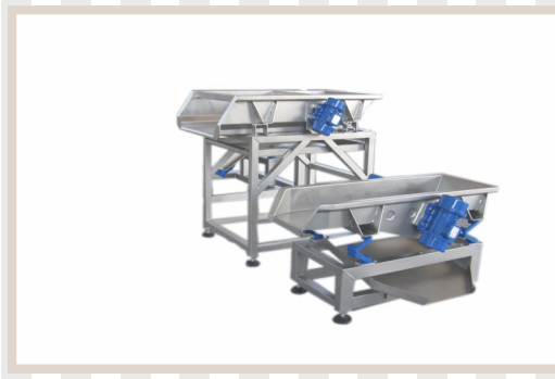
DOSATORI – SEPARATORI Dispenser-divider Distributeur séparateur