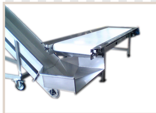
IMPIANTI SELEZIONATORI E DOSATORI System of selection machineries and dispensers Système de machines de sélection et de distribution